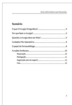
Sumário do Guia Informativo, contendo os tópicos abordados no manual.