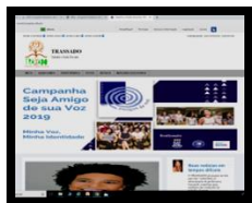
Figura 2: www.trassado.ufba.br